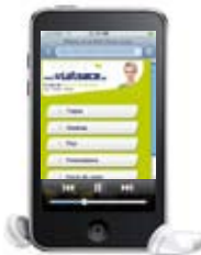
iPod Touch - 8 Go / Accès Internet - 1 750 morceaux - 10 heures de vidéo